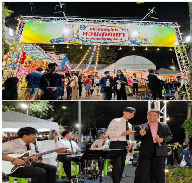
การแสดงดนตรีสด งานกาชาด 100 ปี พ.ศ.2566 วันที่ 8-12 ธันวาคม 2566

คณะศิลปกรรมศาสตร์ มหาวิทยาลัยราชภัฏสวนสุนันทา 14 มีนาคม · ๑ (6 มีนาคม 2567) ชมรมวิชาการออกแบบแฟชั่น นำโดย ผศ.สิริขยา สำลีทอง นำนักศึกษาในสาขาวิชาเข้าศึกษาดูงาน การบริหารจัดการเสื้อผ้าในอุตสาหกรรมเครื่องแต่งกาย ณ บริษัท ทองโง่งการทอ จำกัด ซึ่งเป็นบริษัทที่ผลิตเสื้อผ้าชั้นท่าอยู่ในระดับอุตสาหกรรมขนาดใหญ่ ทั้งนี้ กิจกรรมดังกล่าวเป็นส่วนหนึ่งในรายวิชา FAD3615 วิชาศึกษานิเทศศาสตร์เข้าศึกษาดูงานในหน่วยงานเอกชน หรือสถานประกอบการ ..... งานประชาสัมพันธ์ คณะศิลปกรรมศาสตร์... ดูเพิ่มเติม